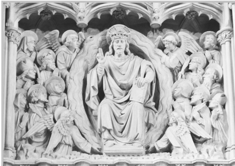
Kathedrale von Truro

W enn Christus der König der Welt ist, dann ist es selbstverständlich, dann haben wir die Pflicht, auch diesen König zu wählen zum König unseres Herzens, zum König unseres Lebens, zum König der ganzen Familie.